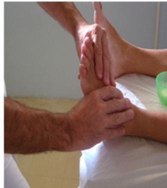
Técnica de Amassamento